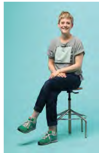
Une styliste haut de gamme.

Deux prix prestigieux : le prix Chloé et le prix du Suisse Design Award. Cela dit déjà beaucoup du talent de cette jeune styliste de 24 ans. La passion commence sur les bancs de l'école communale : le cours de couture est celui qu'elle préfère et qui lui fait attendre le suivant avec impatience. Un stage auprès de Nadia Cuénoud et un bachelors à l'HEAD à Genève plus tard, elle ira se froter à la mode à Londres, New York et Amsterdam. Mais ne vous