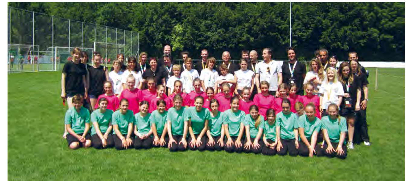
Une forte délégation de gymnastes de Bourg-en-Lavaux.

Les 15 et 16 juin dernier, la Fédération Suisse de Gymnastique de Cully a rejoint les 17000 jeunes qui ont participé à la fête fédérale de gym. Organisée tous les 6 ans, cette grande aventure avait lieu à Bienne.