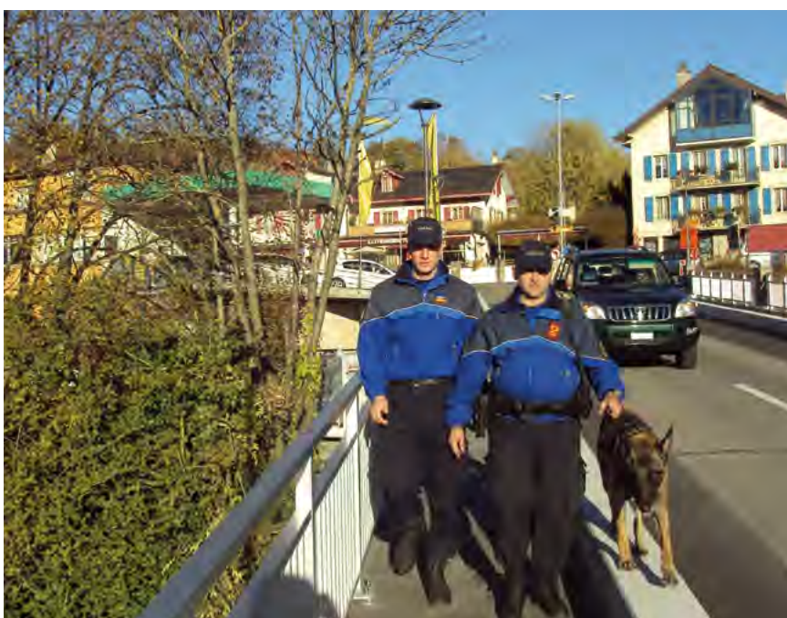
«Protéger et servir», devise de l'APOL.

En septembre 2009, le choix du peuple s'est porté sur une police de proximité, basée sur la coexistence entre police régionale et cantonale. Depuis janvier 2012, l'APOL (Association Police Lavaux) a ainsi repris le contrat de la prévention, de l'administration et de la répression dans notre région. Cette nouvelle organisation n'a pas été choisie au hasard : elle permet une meilleure sécurité, en privilégiant une coordination et une cohérence dans l'intervention policière.