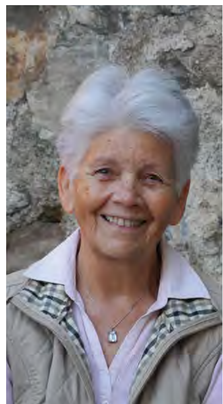
Un beau sourire pour les malades.

Actuellement, quatorze personnes (certaines étaient déjà là au tout début) consacrent leur jeudi après-midi à cette tâche. Un tournus est établi.