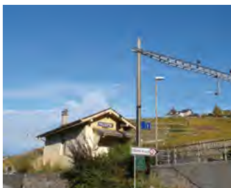
A Villette aussi... (lire en page 6)