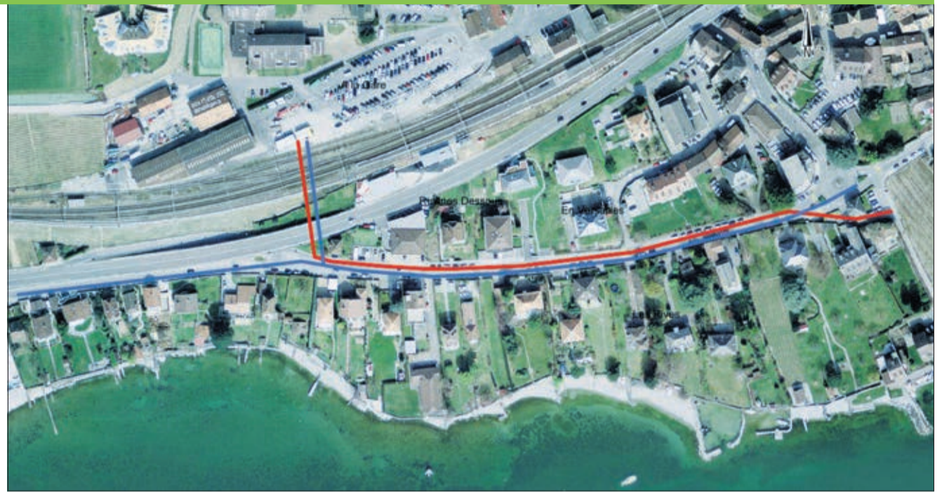
En bleu : conduite d'eau potable ; En rouge : collecteur d'eaux usées

Le collecteur d'eaux usées partira du point le plus bas du plateau de la gare et passera sous les voies CFF pour rejoindre la route de Lausanne. Il se poursuivra jusqu'au carrefour du Carrousel et rejoindra le point de raccordement du collecteur de concentration du Cheminet. Le réseau d'assainissement des eaux claires transite