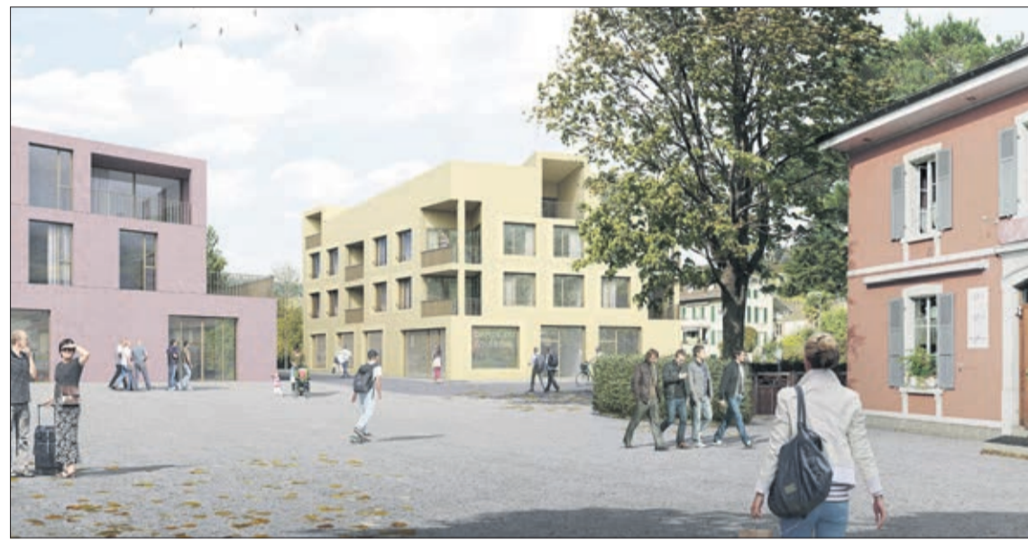
Projet lauréat PLANT ROBERT

Le bâtiment Contesse à Cully, propriété de la commune a été démolé durant le mois d'octobre. Le terrain libéré pourra recevoir des installations provisoires telles que bus, écopoint et installations chantiers.